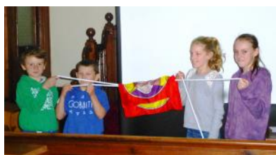
Plant o gapel Blaenycod

Isod mae rhai o'r plant a'r bobl ifanc fu'n cymryd rhan yn yr oedfaon. Am ragor o luniau o bob capel ble bûm yn ymweld ewch i www.micsirgar.org