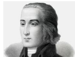
William Williams 1717-91. Y Pêr Ganiedydd

ei fywyd wedi ei drawsnewid yn llwyr gan Iesu oedd William Williams o Bantycelyn. Eleni rydym wedi bod yn dathlu 300 mlynedd ei enedigaeth. Mae'n debyg bod Williams wedi teithio tua 150,000 o filltiroedd ar gefn ceffyl i son am am ei Arglwydd ac wedi cyfansoddi bron 900 o emynau yn canmol ei glod. Mae'r cwpld canlynol o eiddo Williams yn crynhoi ei serch tuag at ei Waredwr: Iesu, Iesu rwyd ti'n ddigon, rwyd ti'n llawer mwy na'r byd.