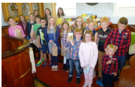
Plant a phobl ifanc o Gapel Seion, Drefach