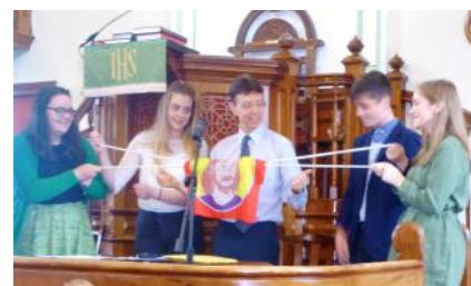
Pobl ifanc o Providence, Llangadog