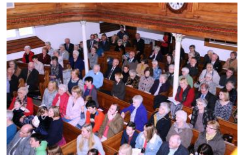
Rhan o'r gynulleidfa luosog a ddaeth ynghyd i'r oedfa, "Joio Gyda Iesu."