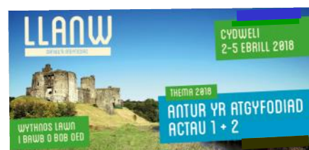
Bydd yr yml Gristnogol "Llanw" yn dod i dref Cydweli yn ystod wythnos Y Pasg 2018.

Mae chwech o glybiau Cristnogol i blant yn cwrdd yn wythnosol mewn gwahanol ardaloedd ar draws sir Gaerfyrddin sef, Llangennech; Penygroes; Caerfyrddin; Rhydaman; Pontyberem a Llanarthne. Maent i gyd wedi eu sefydlu gyda chefnogaeth Henaduriaeth Myrddin ac mewn cydweithrediad â M.I.C.