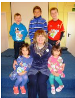
Plant o gapel Cana gyda'i gweinidog