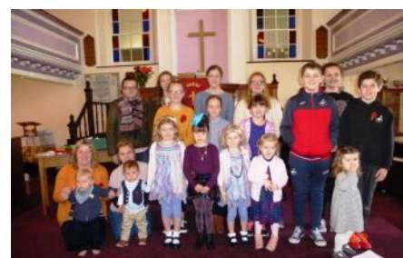
Plant a phobl ifanc o Moriah, Brynaman