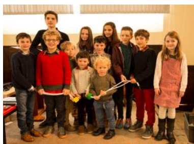
Plant a phobl ifanc o Penuel, Caerfyrddin