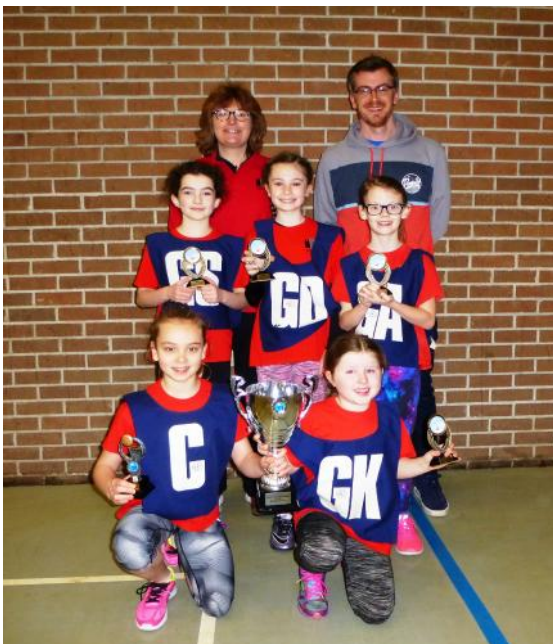
Priordy a Penuel Caerfyrddin Buddugwyr pêl rwyd cynradd.