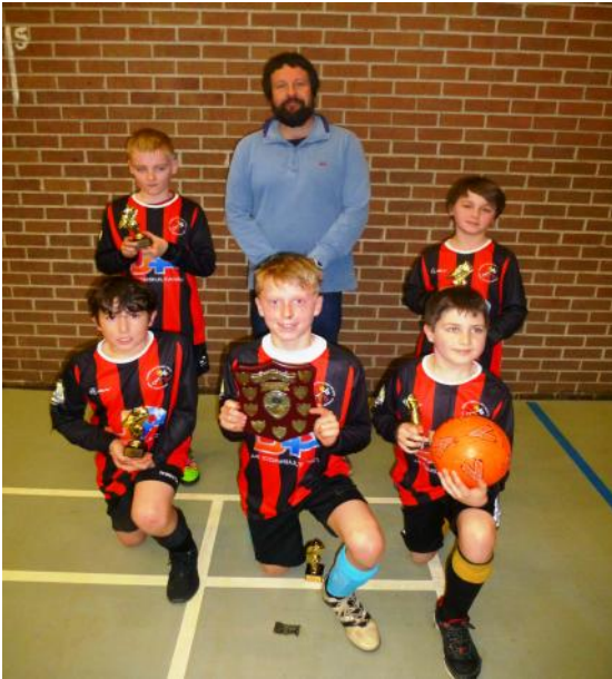
Hope - Siloh Pontarddulais. Buddugwyr pêl droed cynradd.