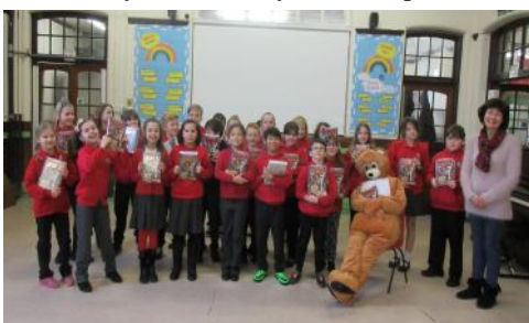
Disgyblion blwyddyn 5 Ysgol Parcyrhun

Mae ar hyn o bryd 6 o glybiau plant Cristnogol cyd enwadol yn bodoli yn sir Gaerfyrddin, wedi ei ffurfio o dan gynllun strategaeth Henaduriaeth Myrddin ac mewn cydweithrediad â M.I.C. Mae'r clybiau yn ceisio meithrin perthynas agos gydag ysgolion lleol. Un ffordd o wneud hyn yw cyflwyno Beiblau plant i'r disgyblion, ac yn ddiweddar bu Clwb J.A.M. Rhydaman yn dosbarthu copiau o'r "Beibl I Blant" i ddisgyblion blwyddyn 5 yn Ysgol Gymraeg Rhydaman; Ysgol Bro Banw ac Ysgol Parcyrhun. (Sylwch fod Tecwyn Y Tedi hefyd wedi bod yn rhoi help llaw!).