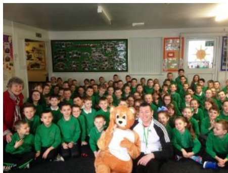
Disgyblion Ysgol Gymraeg Rhydaman