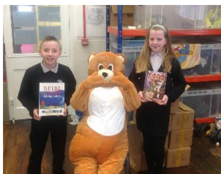
Cynrychiolwyr blwyddyn 5 o Ysgol Bro Banw