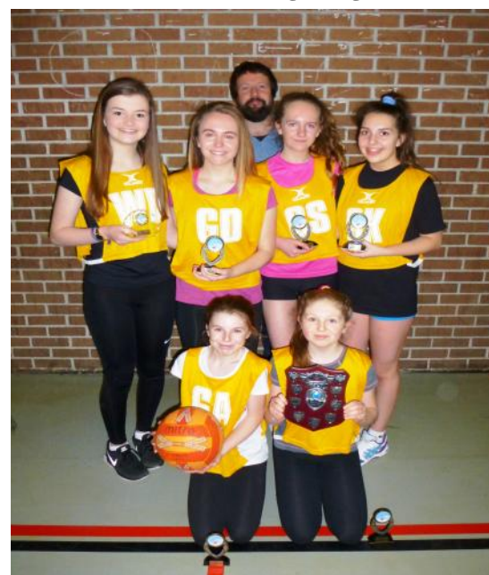
Hope - Siloh Pontarddulais. Buddugwyr pêl rwyd uwchradd.