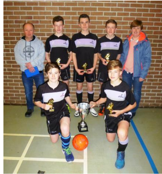
Tabernacl Hendygywyn Ar Daf a Bethlehem Pwll Trap Buddugwyr pêl droed uwchradd.

Ar ddydd Sadwrn Ionawr 28ain yng Nghanolfan Hamdden Caerfyrddin cynhaliwyd cystadlaethau pêl droed a phêl rwyd Ysgolion Sul a chlybiau Cristnogol sir Gaerfyrddin. Mae'r digwyddiad hwn o hyd yn bwysig yng nghalendr yr Ysgolion Sul ac eleni cafwyd yr ymateb gorau ers sefydlu M.I.C. gyda 28 o dimoedd yn cofrestru. Golyga hyn bod tua 140 o blant ac ieuenctid wedi cymryd rhan ac fel arfer daeth tyrfa dda i gefnogi.