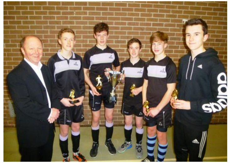
Bethlehem Pwll Trap a Tabernacl Hendygywn Ar Daf Buddugwyr pêl droed uwchradd.

droed buddugol yn cystadlu yn erbyn buddugwyr Ysgolion Sul sir Benfro yng nghystadleuaeth Cwpan Her Penfro - Myrddin. Bu'r ddau dîm yn fuddugol gyda thîm Capel Newydd / Providence, yn curo tîm eglwysi cylch Carn Ingli o 8 - 1. Fe wnaeth tîm Bethlehem / Tabernacl hefyd guro tîm eglwys Casblaidd o 5 - 1. Golyga hyn bod y timoedd uchod yn bencampwyr dros y ddwy sir. Llongyfarchiadau mawr iddynt hwythau ac i bawb wnaeth gymryd rhan yn y cystadlaethau chwaraeon. Am luniau o bob tîm o'r timoedd gwelir www.micsirgar.org