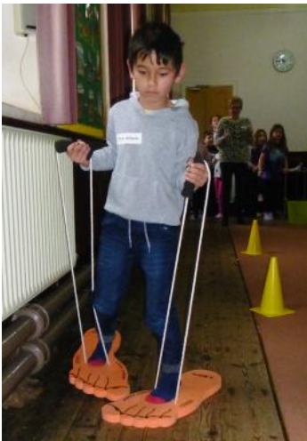
Cael hwyl yn cerdded gyda thraed fel cawr.

Am luniau di-ri sy'n adrodd mwy o'r hanes ewch i www.micsirgar.org