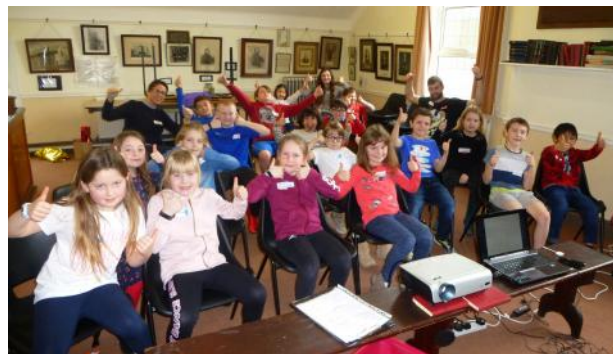
Y plant yn aros yn eiddgar am y stori Feiblaidd.