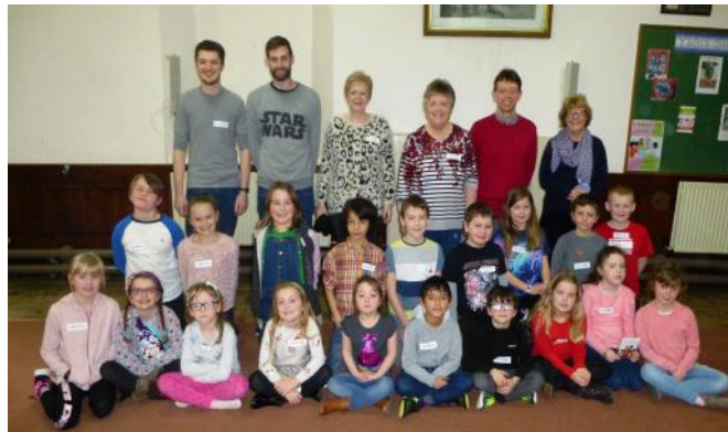
Y plant a'r arweinwyr oedd yn bresennol yn y Clwb Gwyliau ar y diwrnod olaf.