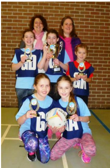
Capel Newydd Llanddarog a Priordy Caerfyrddin Buddugwyr pêl rwyd cynradd.

droed buddugol yn cystadlu yn erbyn buddugwyr Ysgolion Sul sir Benfro yng nghystadleuaeth Cwpan Her Penfro - Myrddin. Bu'r ddau dîm yn fuddugol gyda thîm Capel Newydd / Providence, yn curo tîm eglwysi cylch Carn Ingli o 8 - 1. Fe wnaeth tîm Bethlehem / Tabernacl hefyd guro tîm eglwys Casblaidd o 5 - 1. Golyga hyn bod y timoedd uchod yn bencampwyr dros y ddwy sir. Llongyfarchiadau mawr iddynt hwythau ac i bawb wnaeth gymryd rhan yn y cystadlaethau chwaraeon. Am luniau o bob tîm o'r timoedd gwelir www.micsirgar.org