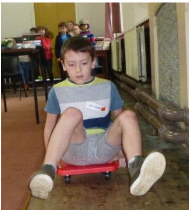
Am y cyntaf ar y bwrdd sgwter.