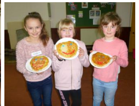
Plant gyda chrempog wedi eu haddurno gydag wynebâu hapus.