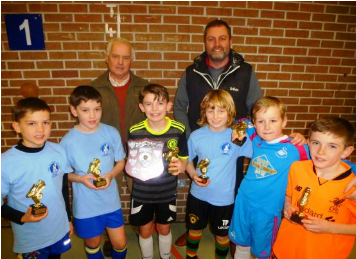
Capel Newydd, Llanddarog a Providence, Llangadog Buddugwyr pêl droed cynradd.

Ar ddechrau'r flwyddyn cynhaliwyd cystadlaethau pêl droed a phêl rwyd Ysgolion Sul a chlybiau Cristnogol y sir. Mae'r digwyddiad hwn o hyd yn bwysig yng nghalendr yr Ysgolion Sul ac eleni cafwyd yr ymateb gorau ers sefydlu M.I.C. gyda 30 o dimoedd yn cofrestru! Bu'n ddiwrnod llawn o gystadlu brwd a daeth tyrfa dda i gefnogi'r plant a'r bobl ifanc. Dyma'r timoedd a fu'n fuddugol ar y dydd: