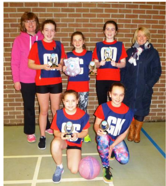
Priordy Caerfyrddin Buddugwyr pêl rwyd uwchradd.