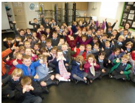
Plant ysgol Llanddarog yn mwynhau yn ystod gwasanaeth y bore.

Yn ystod y tymor hwn rwyf wedi cael y fraint o ymweld â nifer o ysgolion, megis Y Dderwen Caerfyrddin, Llangynnwr, Abergwili, Peniel, Nantgaredig, Cwrt Henri a Llanddarog. Bûm yn ymweld â phob ysgol dwywaith yr un i gymryd gwasanaeth ac i wahodd y plant i fynychu clybiau yn ystod gwyliau hanner tymor a'r Pasg. Derbyniais groeso arbennig ym mhob un o'r ysgolion a chafwyd tipyn o hwyl wrth gyflwyno'r newyddion da mewn ffyrdd cyfoes.